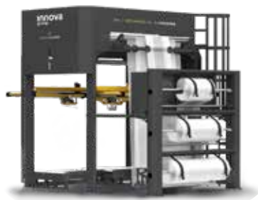
STRETCH HOOD TECHPRO XL