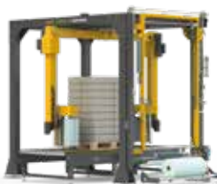
ENVOLVEDORA DE BRAZO AWS | PRO / TECHLITE