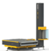
PLATAFORMA AUTOMÁTICA AWT | PRO