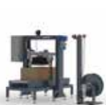
FLEJADO DE CAJAS FC | PRO