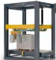
ENVOLVEDORA DE ANILLO AWR | PRO