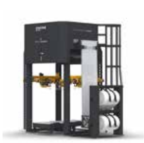
STRETCH HOOD TECHPRO