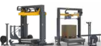
FLEJADO VERTICAL FV | PRO CON/SIN DOBLE CABEZAL + PRENSA