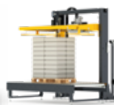
FLEJADO HORIZONTAL FH | PRO CON/SIN COMPACTADOR