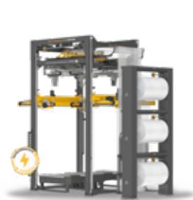
STRETCH HOOD TECHMAX