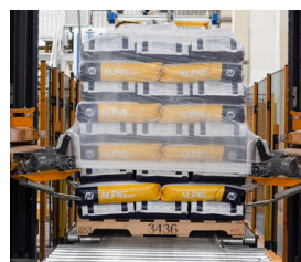
AGROALIMENTARIO Y PETFOOD