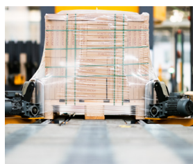
CERÁMICA Y CONSTRUCCIÓN