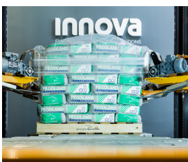
QUÍMICO Y CEMENTO