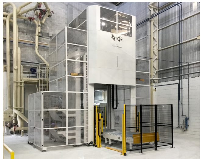
Líneas automáticas de embalaje de Innova para el sector de químico y sólidos