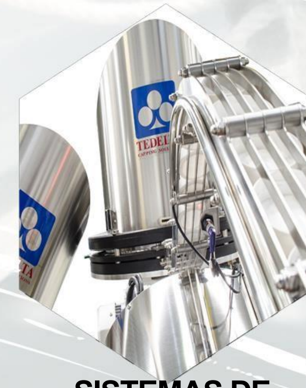
SISTEMAS DE ALIMENTACIÓN