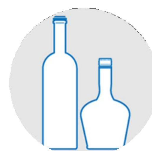
VINOS Y LICORES